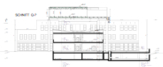
Fig. 05/1 1:200

Das neue Unterrichtsgebäude ist ein zentrales Element der Erweiterung und ist mit einem breiten Korridor verbunden, der als Treffpunkt für Schüler und Lehrer dient. Die Klassenräume sind in Gruppen angeordnet und verfügen über moderne Ausstattung wie Beamer und Internetzugang. Der Musikraum ist ein geräumiger Raum mit einer professionellen Ausstattung für Musikunterricht und Aufführungen. Das Theaterstudio ist ein kleiner, flexibler Raum, der für Theateraufführungen und Workshops geeignet ist. Der Hörsaal ist ein geräumiger Raum mit einer breiten Bühne und einer guten Akustik für Vorträge und Veranstaltungen.