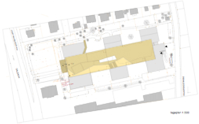
Fig. 01/1 1:500