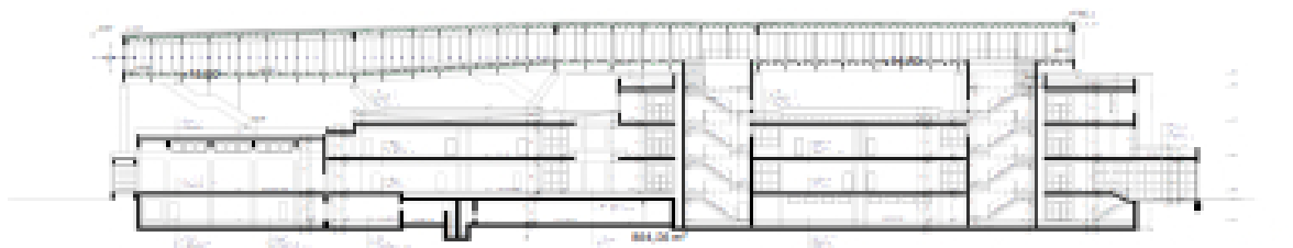
Fig. 04/1 1:200

Das Projekt besteht aus der Sanierung und Erweiterung des bestehenden Gebäudes um ein neues Unterrichtsgebäude mit 12 Klassenräumen, einem Musikraum, einem Theaterstudio und einem Hörsaal. Die Erweiterung ist als ein- bis zweigeschossiges Gebäude mit einem flachen Dach und einer Fassade aus Glas und Metall ausgeführt. Die Sanierung umfasst die Erneuerung der Fassade, der Dachstuhl- und der Inneneinrichtung. Die Erweiterung ist mit dem bestehenden Gebäude verbunden und bildet einen integralen Bestandteil des Gebäudes.